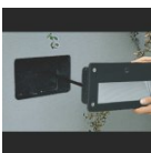
Thor/01 D51/01-CI D51-01-CI